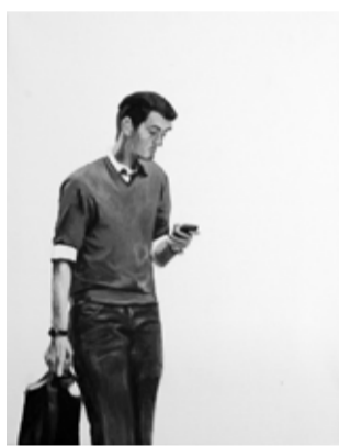
Sašo Vrabčič: Pametni telefon, akril na platno, 30 x 24 cm, 2014

Delo Izginjajoči poljub je serija sedmih risb s tušem na prosojen papir, ki prikazuje par med poljubom. Intenzivnost barve je na vsaki ponovitvi šibkejša, zato se risba pred našimi očmi postopoma razblinja v nič. Zaradi upodobljenega prizora, slikarskega načina in krškega papirnega nosilca delo deluje zelo poetično. Sašo Vrabčič v svoji značilni maniri združuje več medijskih namigov. Razdelitev prizora na sekvence spominja na filmski trak. Tudi sam ljubezenski prizor spominja na prizore iz starih črno-belih filmov. Podoba se razblinja na način, ki spominja na kinematografsko tehniko ugašanja slike (fade out). Takšno zastrtje slike pogosto označuje konec filma, tako kot razvođenel poljub pomeni konec ljubezenske zgodbe. Ne nazadnje, format cele kompozicije ter prosojna tekstura slikarskega nosilca spominjata na kinematografsko platno. Na