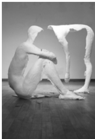
Katja Oblak: Ples iz cikla Sodelovanja (detajl), odtis, papir, do 185 cm, 2014

vključuje tudi performativne prakse, ki se naslanjajo na ples Butoh. Zaradi tega se zdi njeno dojetje telesa bliže intuiciji vzhodnjaških, kot racionalizmu zahodnih kultur.